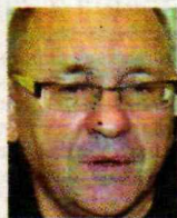
Jerzy Owsiak, szef Wielkiej Orkiestry Świątecznej Pomocy:

Nowoczesny ultrasonograf od Wielkiej Orkiestry Świątecznej Pomocy dla szpitala. Sprzęt służy już pacjentom