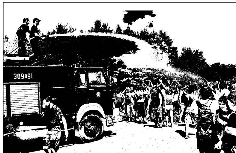
Strażacy polewali zmęczonych upałem i kurzem woodstockowiczów strumieniem chłodnej wody. Chętnych nie brakowało...