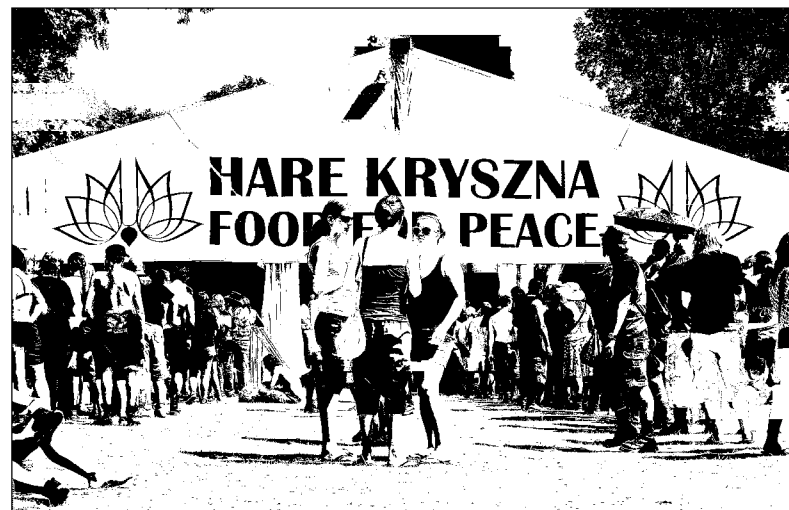
Tańce, joga, prelekcje i koncerty czekały na chętnych w wiosce Kryszny. Jednak najczęściej odwiedzianym tu miejscem był namiot z wegetariańskim jedzeniem.

- podczas trwania festiwalu zdarzyło się zaledwie kilkanaście drobnych kradzieży. I to w kilkuset-tysięcznym tłumie. Mile zaskoczony był mój kolega, który zostawił otwarty namiot z leżącymi na wierzchu: portfelem, komórką i aparatem fotograficznym. Nic mu nie zginęło. Wiele osób przyjeżdża na