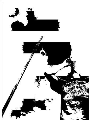
Kto potrzebował mocnych wrażeń, skakał na bungee