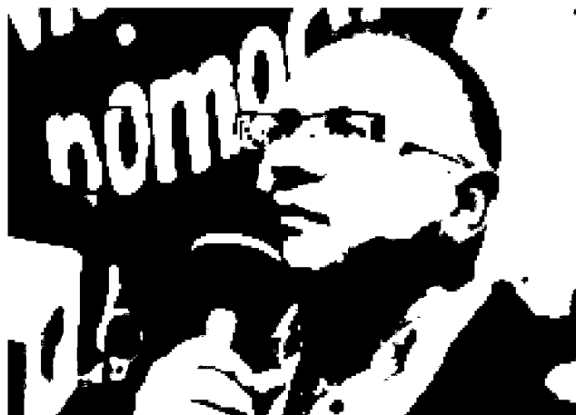
— 4 lipca poproszę Polaków, aby obdarowali nas swoim dobrym sercem — mówi Jurek Owskiak

Olsztyn jako jedno z niewielu miast nie włączył się do organizacji akcji. Ale można wesprzeć powodzian wysyłając SMS na numer 7547 o treści STOP (koszt: 6,10 zł). Uwaga! Ten numer aktywny jest tylko dziś — 4 lipca!