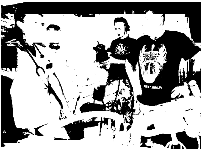
Jerzy Owsiak oglądał aparat USG zakupiony przez Orkiestrę w tym roku za 141 tysięcy złotych

Oddział neonatologiczny legnickiego szpitala jest największy na Dolnym Śląsku. Dzięki darom Orkiestry stał się też jednym z najlepszych w regionie. Uzyskał III stopień referencyjności.